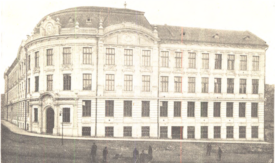
DIE K. K. STAATS-REALSCHULE IN TESCHEN.